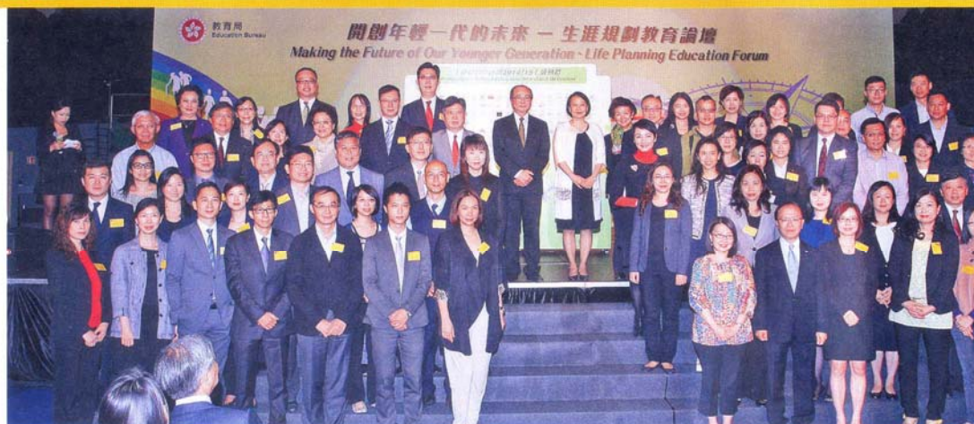
■教育局局長吳克儉及常任秘書長謝凌潔貞主持「商校合作計劃2014/15」啟動禮與工商界夥伴合照。

教育局於十一月十日舉辦「開創年輕一代的未來－生涯規劃教育論壇」藉此加強公眾對生涯規劃的認知，動社會各界，尤其工商界，支持生涯規劃教育。透過生涯規劃教育及商校合作活動，學生可了解工商企業的運作，並認識不同的工種，並根據學生個人的興趣、能力、方向作出升學及就業選擇，將事業及學業與終身學習連結。