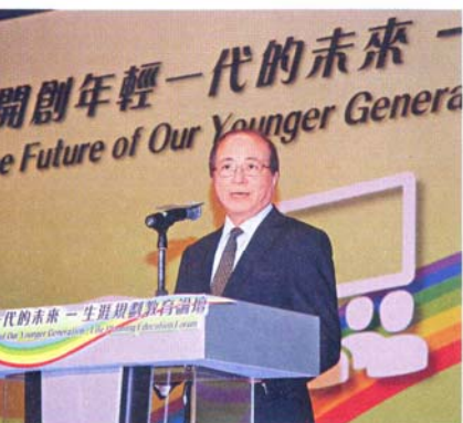
■教育局局長吳克儉以五個英文字「V PASS」來闡明生涯規劃教育的概念。