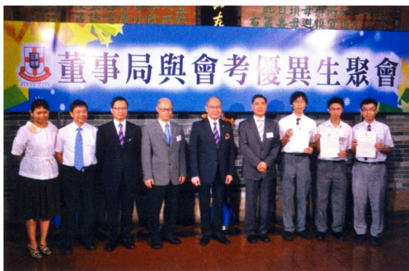
● 東華會考成績嘉許禮

將「不能、有限」等消極思想打消，讓學生按自己的興趣、能力去增修額外的心儀科目等，讓學生飛起，他們想有多高，就讓他們升多高。事實上，增修科目的成績，也是學校的最佳。不要打壓，要扶持；不能看扁，要跟學生一同夢想。最後，假如老師都視學生為兒女般栽培，我們也不會再有平凡的學校！